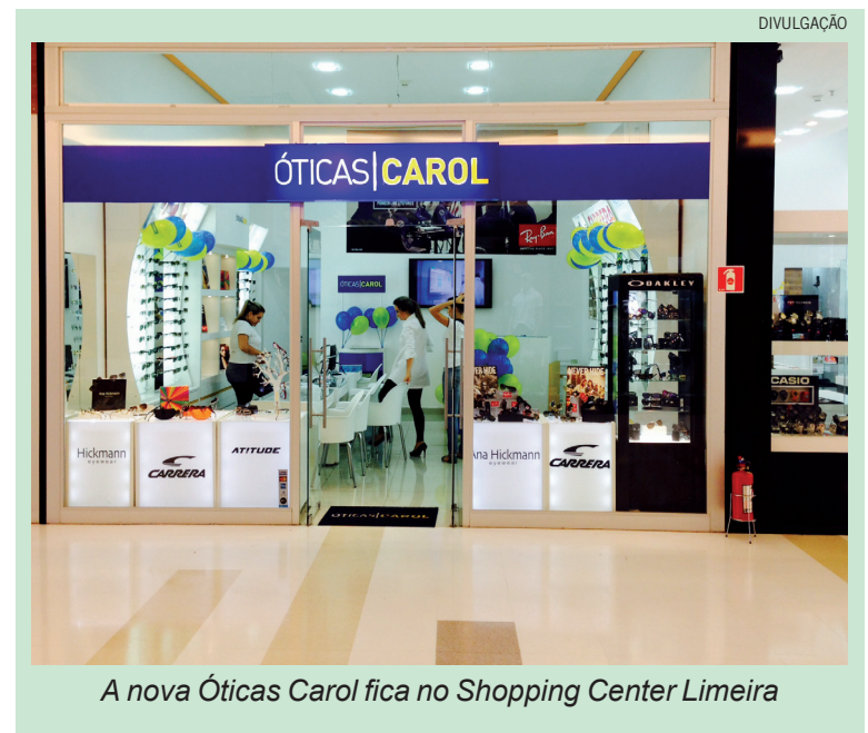
A nova Óticas Carol fica no Shopping Center Limeira

“Agradecemos toda a população de Limeira pela receptividade com nossas lojas e também pelos 9 anos da franquia na cidade. Esperamos por sua visita em uma das 5 lojas Óticas Carol em Limeira”, ressalta o proprietário.