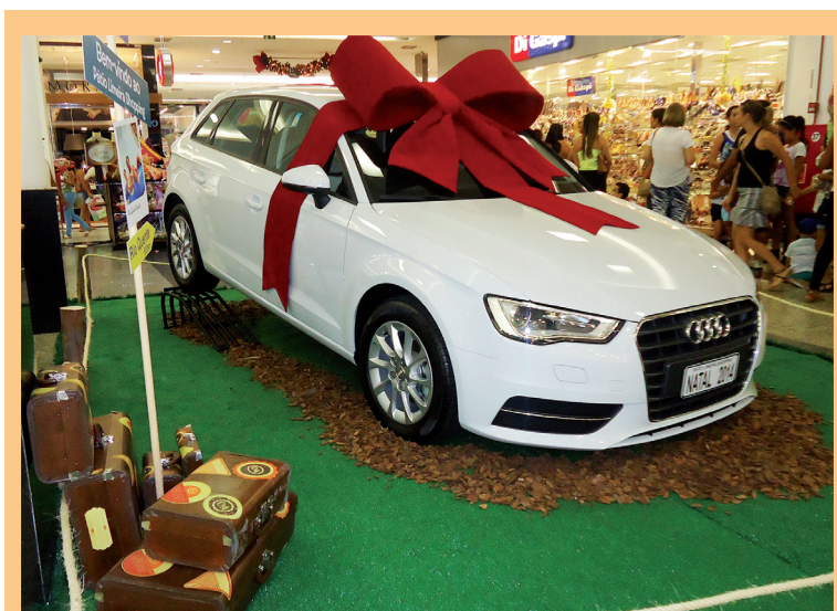
O Pátio Limeira Shopping sorteará um automóvel Audi A3 Sportback 0km e dois pacotes de viagens ao Rio Quente Resorts