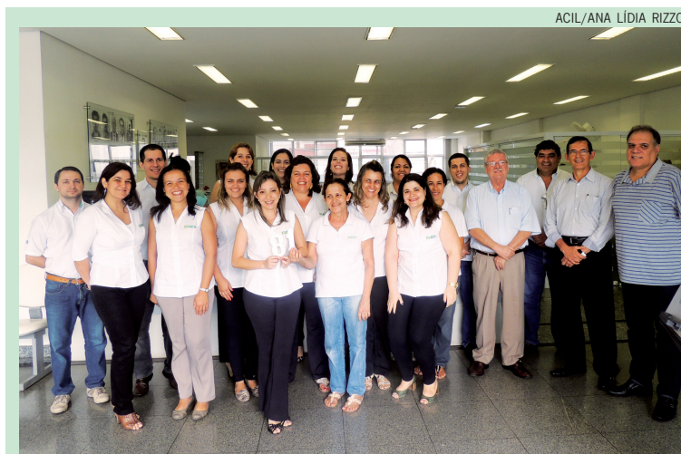
Funcionários e diretores em comemoração de mais um aniversário