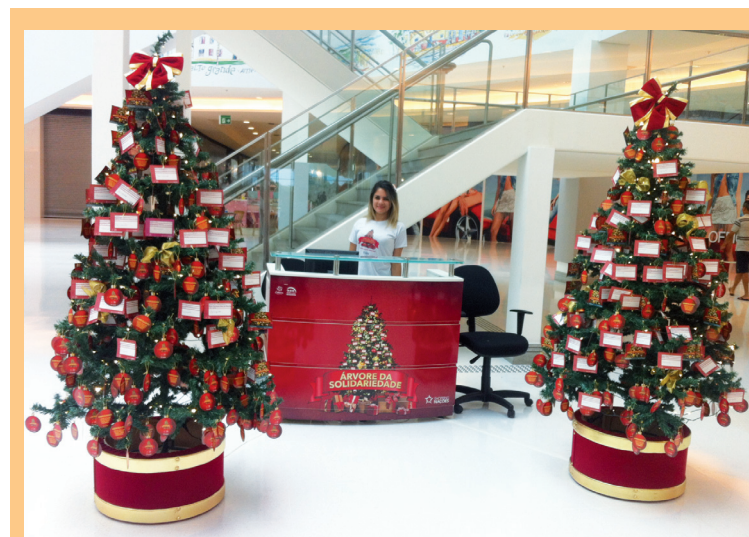
A Árvore de Solidariedade do Shopping Nações Limeira tem como frutos cartões que trarão informações sobre 683 crianças