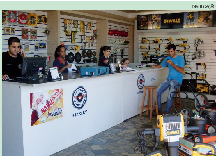
Atendimento na oficina da RR garante agilidade ao cliente e durabilidade aos equipamentos

A linha de produtos pode ser encontrada nas lojas da RR em Limeira, Iracemápolis e Artur Nogueira. A RR é uma das poucas unidades autorizadas em todo o Brasil a possuir o selo na categoria “5 estrelas” de assistência técnica para DeWalt, Black & Decker e Stanley, com a oficina certificada localizada em Limeira para atendimento regional na avenida Fabrício Vampré, 664, jardim Nova Itália, telefone 3445-4449.