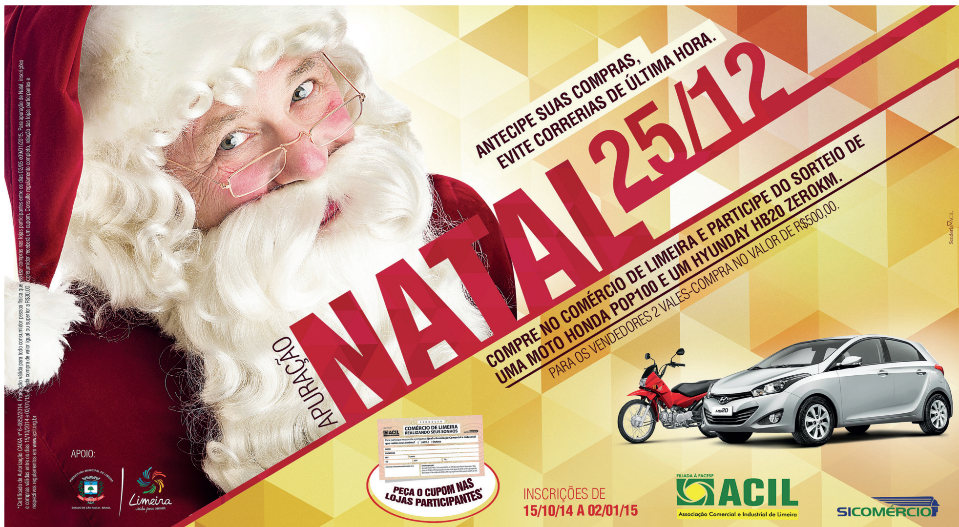
Papai Noel chega na Praça do Toledo Barros no dia 8 de dezembro, acompanhado das noeletes, Banda Arthur Giambelli, corais e Clube de Carros Antigos